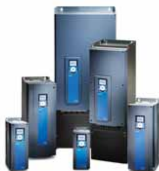
Do montażu ściennego

Przetwornice AC VACON® 100 INDUSTRIAL i VACON® 100 FLOW są idealnym rozwiązaniem zapewniającym oszczędność energii, optymalizację sterowania procesami i zwiększenie produktywności. Łączą funkcjonalność i wielozadaniowość z łatwością obsługi dla użytkownika. Serie VACON® 100 INDUSTRIAL i VACON® 100 FLOW to rdzeń tego, co robimy — zapewniamy innowacyjne i niezawodne produkty wysokiej jakości dla najważniejszych aplikacji w różnych branżach. Nadają się idealnie do szerokiego zakresu aplikacji wymagających stałej mocy/momentu, w tym aplikacji związanych z pompami, wentylatorami, sprężarkami i przenośnikami. Są to aplikacje, w których poprawa sprawności energetycznej i zwiększenie produktywności często skutkują szybkim zwrotem z inwestycji.